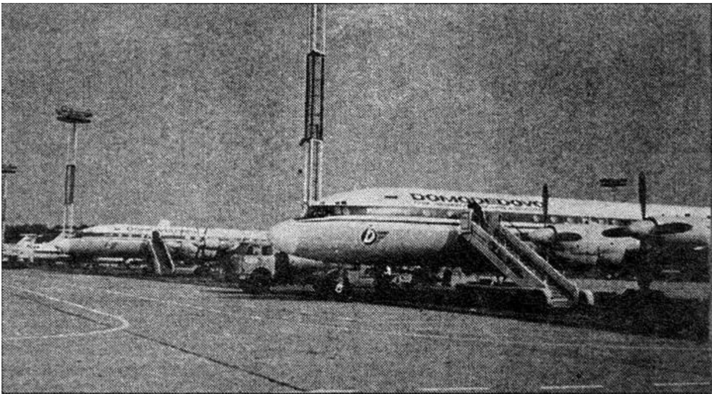
1997 г. Ил-18 в аэропорту Домодедово

Тем не менее, 267-й продолжал состоять на службе в Домодедово. Дальнейшие факты его летной биографии убедительно говорят о поразительной всеядности самолета Ил-18.