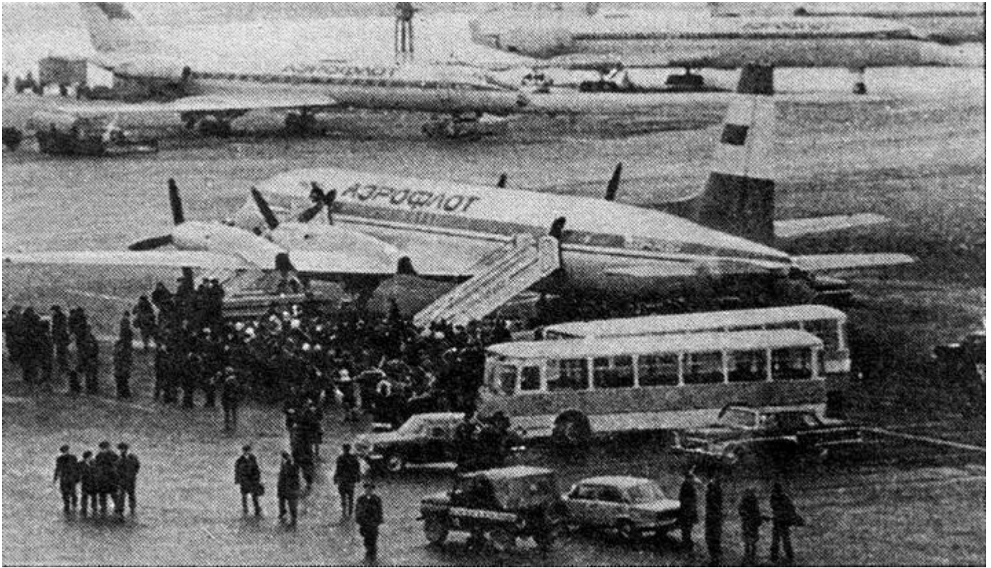
Февраль 1980 г. Борт 74267. Прилет во Внуково из Антарктиды.